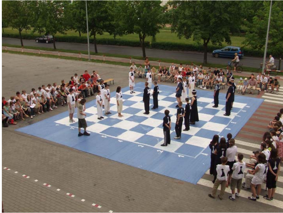
Gra dobiega końca: