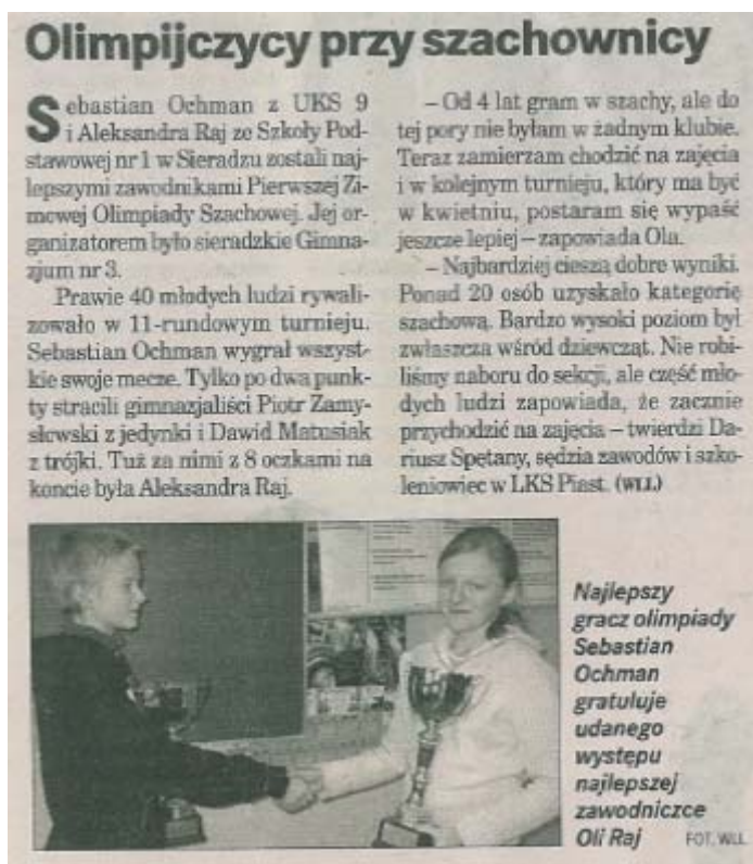
”Nad Wartą” 2007 r.