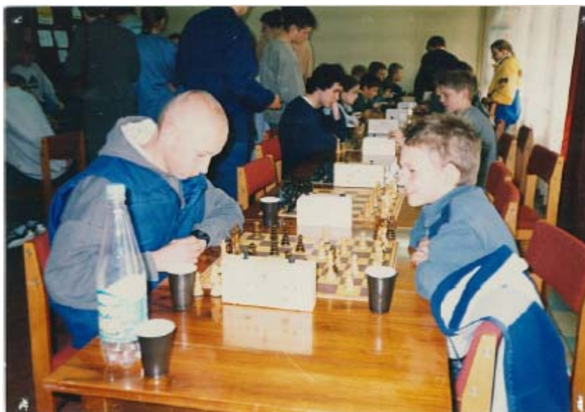
Rozgrywki Ligi Juniorów Sieradza 2004 r.